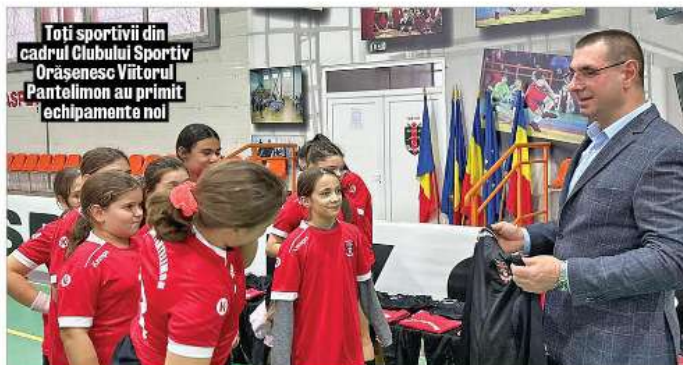
Toți sportivii din cadrul Clubului Sportiv Orașenesc Viitorul Pantelimon au primit echipamente noi

proiect pentru construcția a 18 blocuri, parte dintr-un ansamblu de locuințe colective de serviciu și locuințe pentru tineret P+6E, amenajare accesuri carosabile și pietonale, parcuri, spații verzi și de agrement, spații conexe. Vor fi amenajate 1.008 apartamente în blocuri care vor asigura un confort mărit, cu costuri de întreținere reduse față de blocurile clasice. În cele 18 blocuri se vor găsi 72 de apartamente cu o cameră și 936 de apartamente cu două camere. Durata