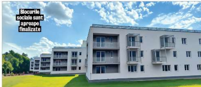
Blocurile sociale sunt aproape finalizate

În încheiere, doresc să adresez cele mai calde urări de bine doamnelor din orașul nostru cu ocazia zilelor de 1 și 8 martie. Sunteți o putere în comunitatea noastră, mame, fice, soții și prietene, iar dedicarea și contribuția voastră sunt de neprețuit. Vă urez o primăvară plină de bucurie, lumină și realizări! Să fiți mereu înconjurate de dragoste și sănătate!