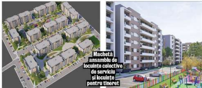
Macheta ansamblu de locuințe colective de serviciu și locuințe pentru tineret